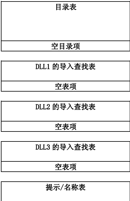
图 3. 典型的导入节布局

所有导入符号的映像文件，实际上几乎包括所有的可执行（EXE）文件，都有 idata 节。文件中导入信息的典型布局如下：