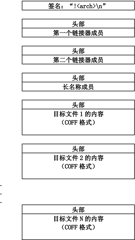
图 4. 档案文件结构