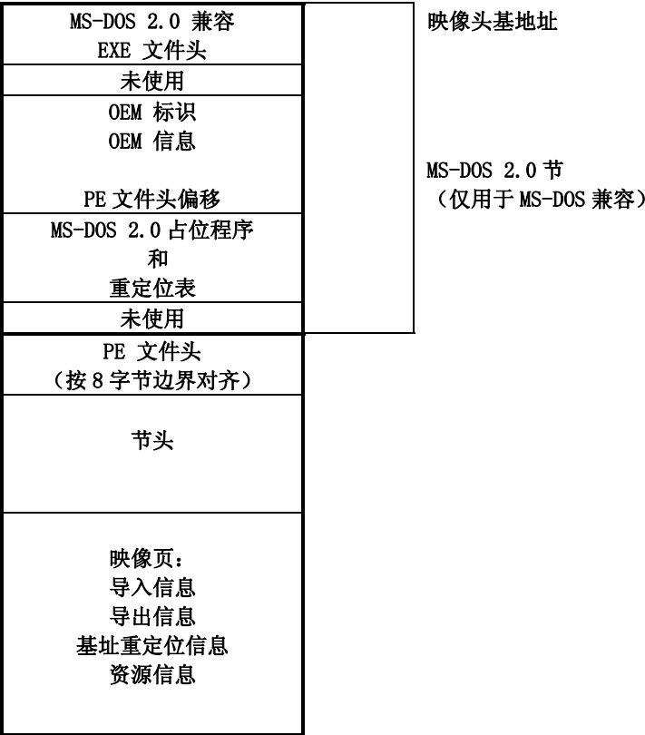
图 1. 典型的可移植 EXE 文件布局