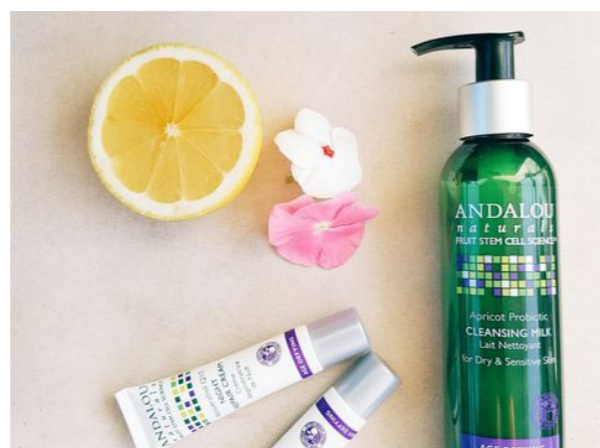
Sản phẩm chiết xuất hoàn toàn từ thiên nhiên, an toàn cho người sử dụng