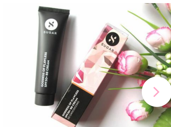
Cách làm đẹp da mặt đơn giản mỗi ngày cho người bận rộn