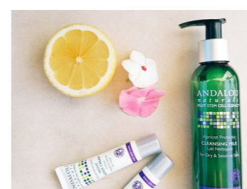
Sản phẩm chiết xuất hoàn toàn từ thiên nhiên, an toàn cho người sử dụng