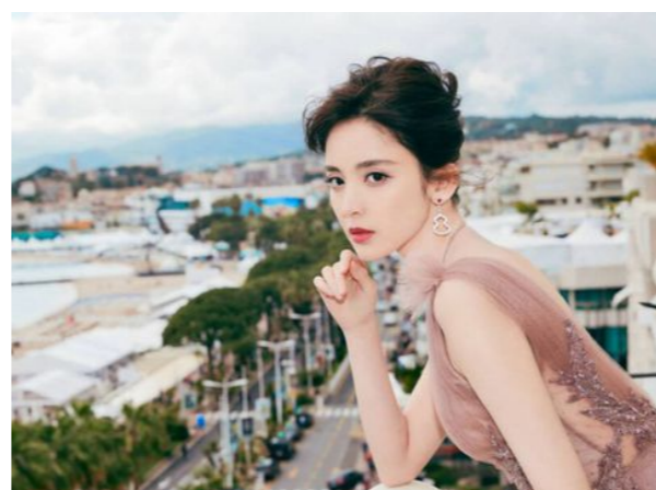
Mẫu áo sành điệu, bất chấp trời mưa sẽ thành hot