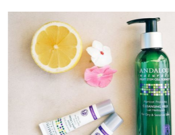
Mỹ phẩm Genie Hàn Quốc có tốt như quảng cáo