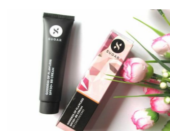
Cách làm đẹp da mặt đơn giản mỗi ngày cho người bận rộn